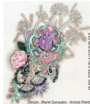
Dessin : Marie Gonzales - Artiste Peintre