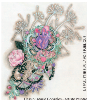
Dessin : Marie Gonzales - Artiste Peintre