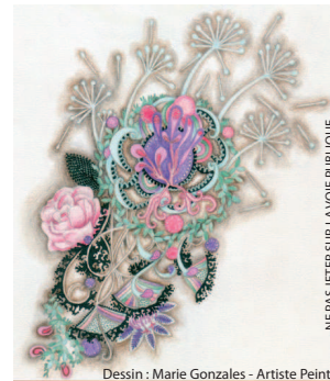
Dessin : Marie Gonzales - Artiste Peintre